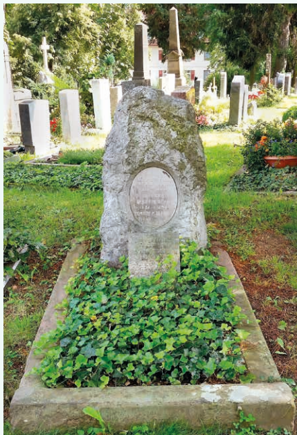
Abb. 4: Grabstätte der Familie Martin auf dem Bergfriedhof in Stuttgart. (Foto: Katharina Koch)

GH: Zu seiner Zeit sahen die Schausammlungen in den naturkundlichen Museen so aus: Die Präparate waren nacheinander in langen Reihen und meistens in einer einheitlichen Grundhaltung aufgestellt. Da war kein Leben erkennbar, es diente rein wissenschaftlichen Zwecken. Martin machte Vorschläge und wirkte darauf hin, die Tierpräparate in der Bewegung zu modellieren und auch nicht nur ein einziges Exemplar zu zeigen, sondern eine ganze Gruppe zu präsentieren, also beispielsweise eine Tierfamilie oder ein Rudel, und das möglichst in einer naturähnlichen Umgebung. Dazu wurden gemalte Hintergründe angefertigt und es brauchte auch Oberlichter. Es entstand also das, was später ein Diorama genannt wurde, mit dessen Einsatz sich die Naturkundemuseen erheblich veränderten und für ein breites Publikum interessant wurden. An dieser Entwicklung war Martin wesentlich beteiligt.