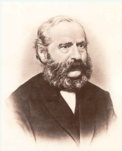
Abb. 3: Portrait von Philipp Leopold Martin (aus: Praxis der Naturgeschichte; Erster Teil: Taxidermie. 3. Auflage. Weimar: Voigt 1886, Vorseite).